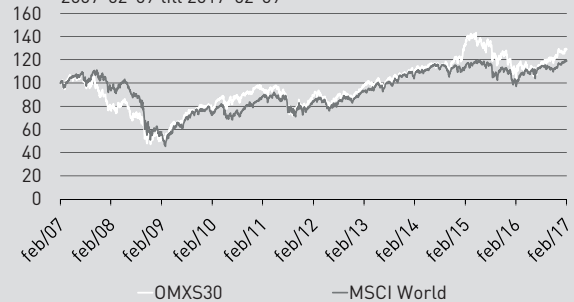
Historisk kursutveckling* 2007-02-09 till 2017-02-09

OMXS30 är benämningen på ett index över de 30 mest omsatta aktierna på Stockholmsbörsen. OMXS30 är ett kapitalviktat index som mäter kursutvecklingen, det vill säga de ingående aktiernas andel av indexet bestäms av aktuellt börsvärde för respektive bolag. För mer info, se www.nasdaqomxnordic.com .