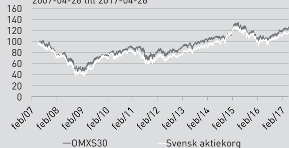
Historisk kursutveckling* 2007-04-26 till 2017-04-26