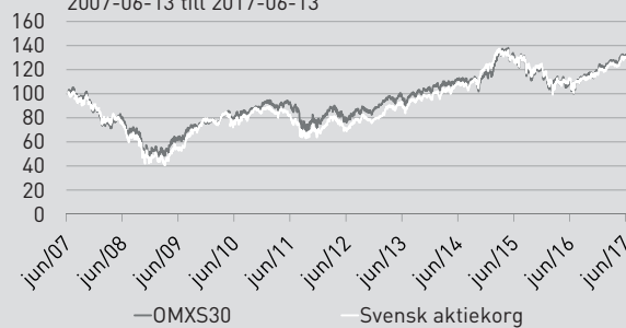
Historisk kursutveckling* 2007-06-13 till 2017-06-13