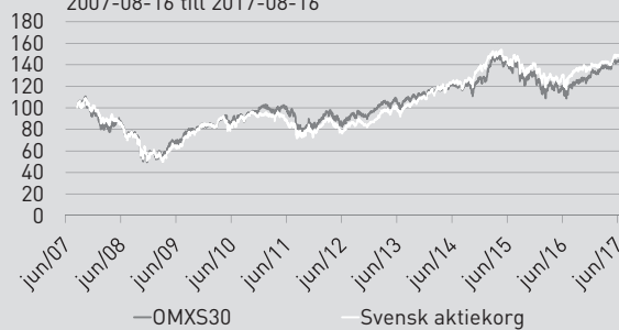
Historisk kursutveckling* 2007-08-16 till 2017-08-16