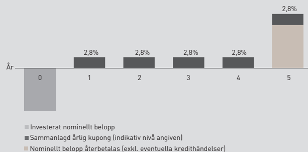
Illustration - Kreditcertifikat Investment Grade Europa Kvartalsvis nr 4335

Utbetalning av kupongerna sker kvartalsvis från och med den 9 april 2022 fram till och med 9 januari 2027. Utbetalning baseras på antalet dagar i förhållande till ett helt år som har passerats under innevarande år. Första årets sammanlagda kupong kan därför vara lägre eller högre beroende på om perioden är kortare eller längre än ett år. Denna förenklade illustration visar den indikativa kupongen om 2,8% per år.