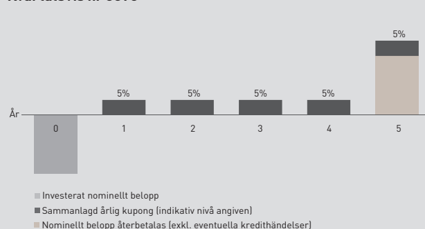
Illustration - Kreditcertifikat Investment Grade Europa Kvartalsvis nr 3893

Utbetalning av kupongerna sker kvartalsvis från och med den 9 juli 2020 fram till och med 9 januari 2025. Utbetalning baseras på antalet dagar i förhållande till ett helt år som har passerats under innevarande år. Första årets sammanlagda kupong kan därför vara lägre eller högre beroende på om perioden är kortare eller längre än ett år. Denna förenklade illustration visar den indikativa kupongen om 5% per år.